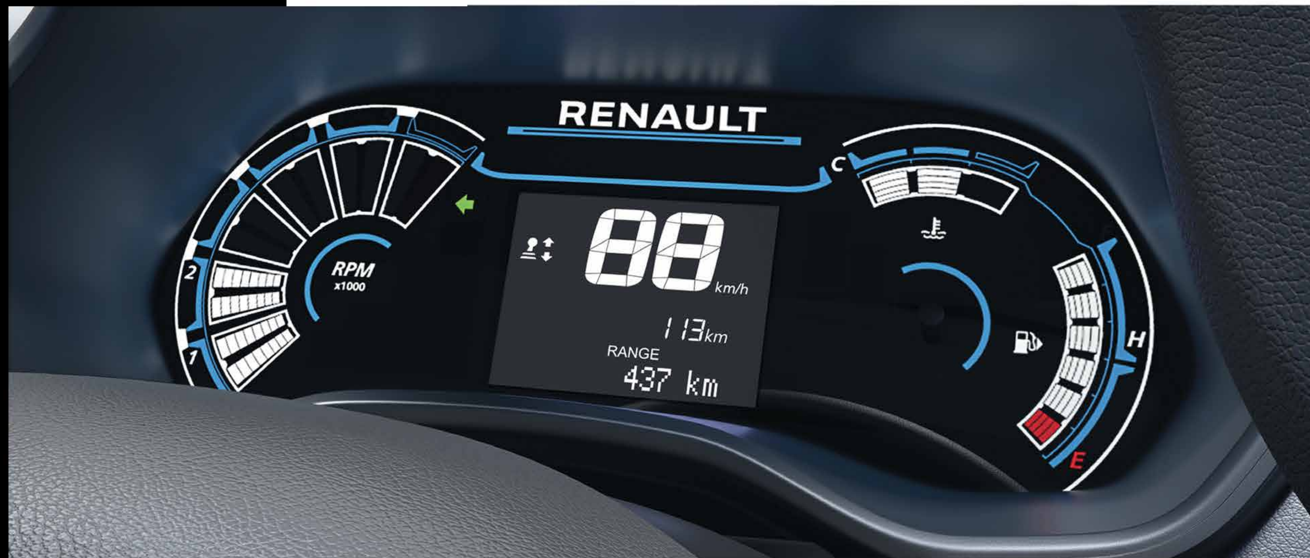
LED Instrument Cluster