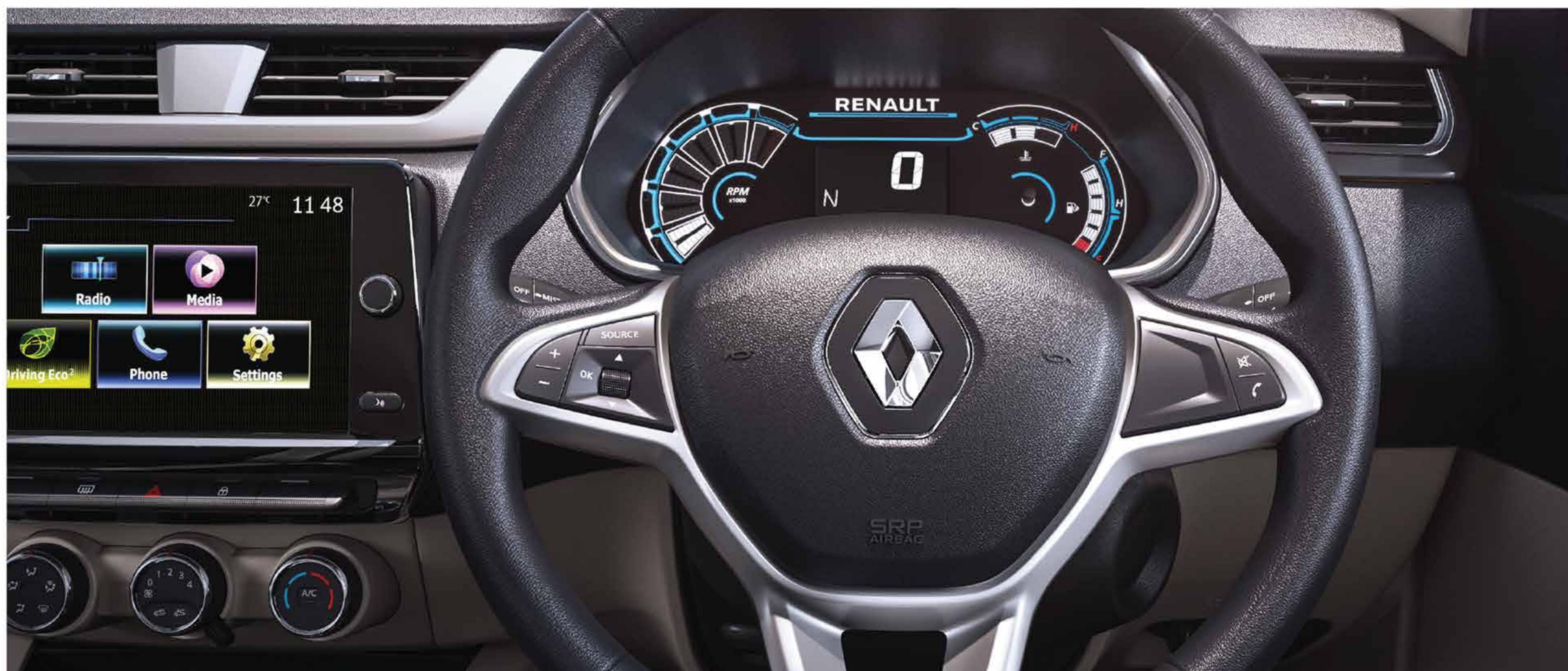
steering mounted audio & phone controls