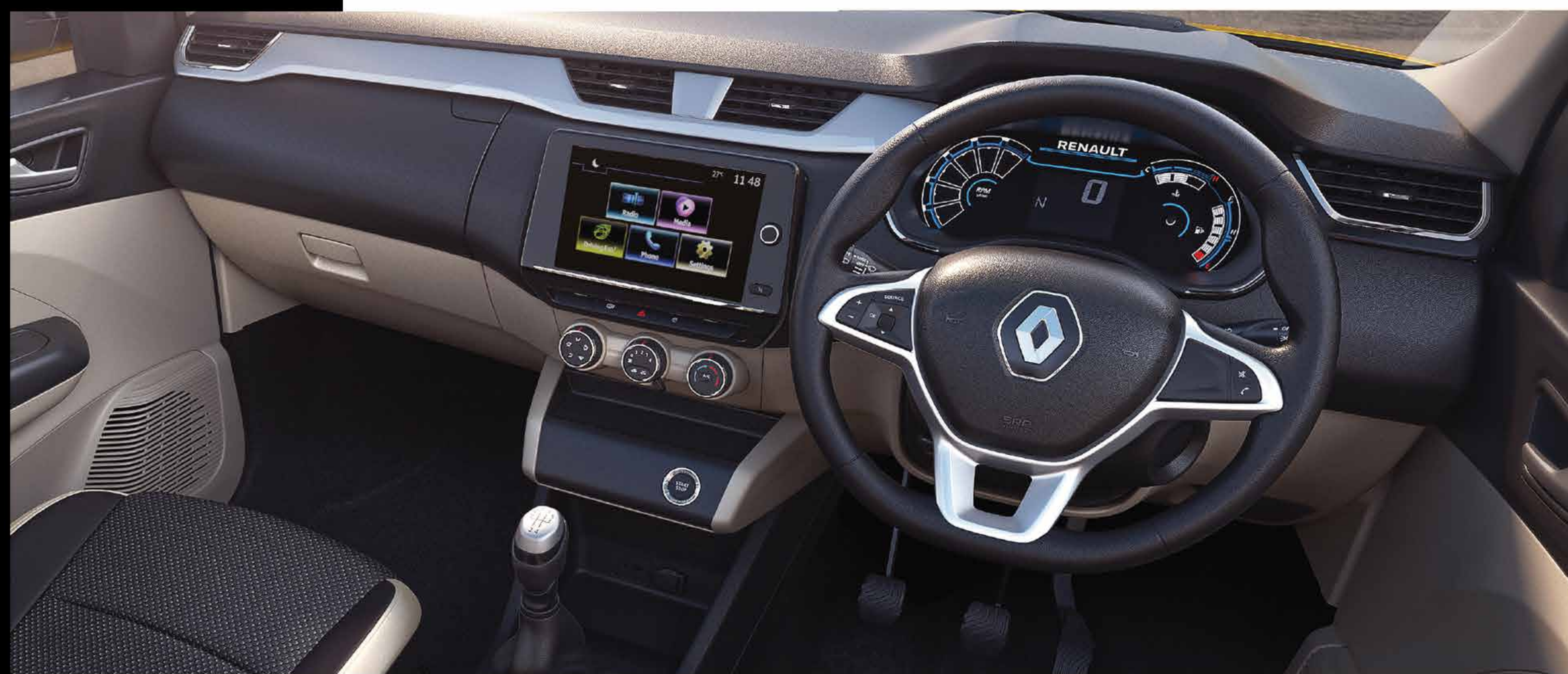
20.32 cm touchscreen mediaNAV evolution | stylish dual tone dashboard with silver accents